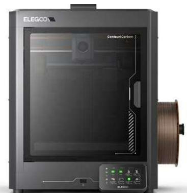
Figure 2: ELEGOO Centauri Carbon