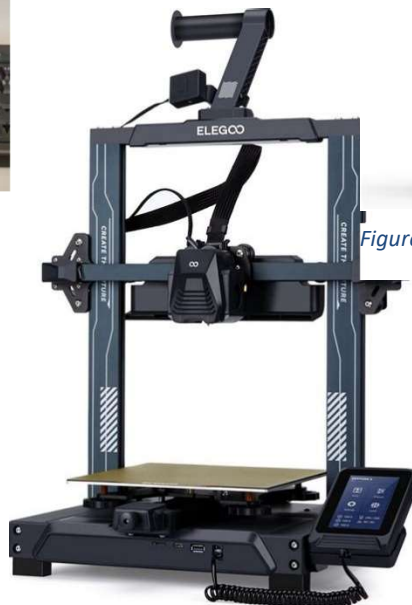
Figure 3: ELEGOO Neptune 4 Pro