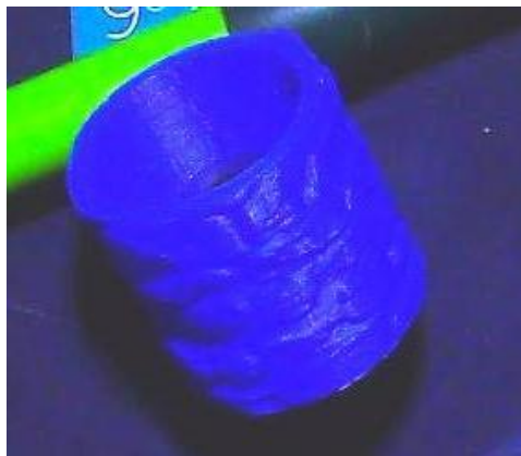
Exemple d'impression 3D après application d'une texture « pierre ».